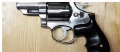
S&W Mod 66-1