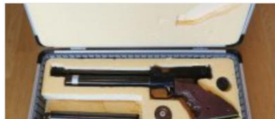
CO2 Luftpistole Feinwerkbau