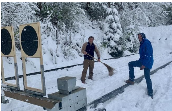
Auch Trub musste mit dem Schnee kämpfen.

Wegen des Aargauer Kantonschützenfestes ist das Zofinger Stadtschiessen um ein Jahr ausgefallen, und wurde heuer wieder durchgeführt. Die PS Stans stellten eine Gruppe von der auch drei Schützen die Kombination 300 m / 50 m absolvierten. Mit der Pistole sah die Gruppenrangliste so aus: 1. Rg. «Tiefmatt» SV Oberbuchsiten 696 Pte., 2. Rg «Lagavulin» PSB Reiden 682 Pte, 3.Rg. «Büchel» SV Zunzgen-Tenniken 678 Pte. und 11. Rg. PS Stans «Winkelried» 638 Pte.