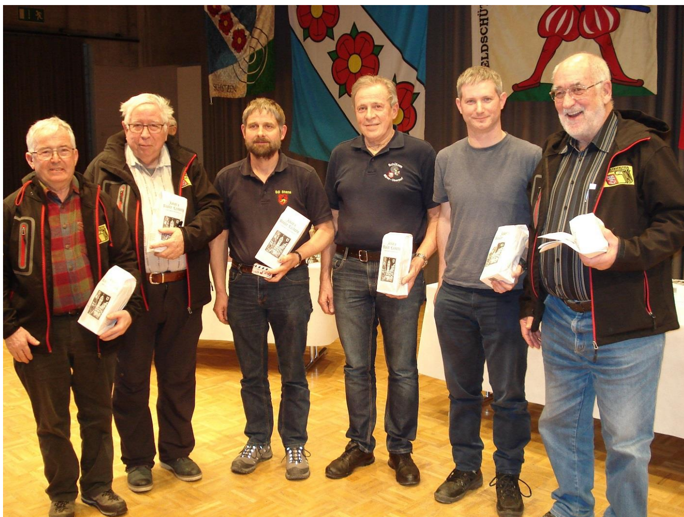
Die Gruppe «Stanserhorn»