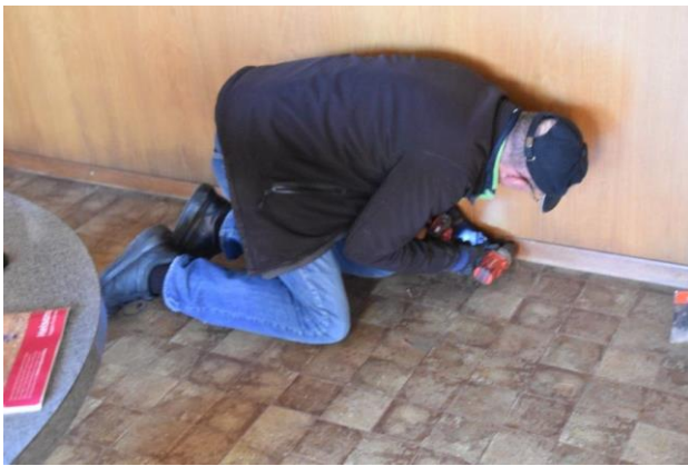
Die Sockelleisten entfernen