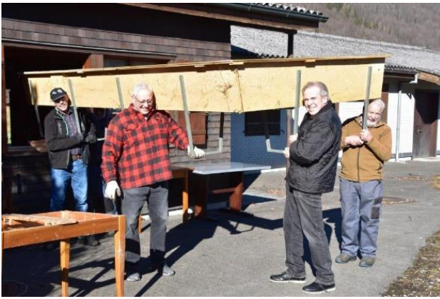
Der Eckbank zum Fenster hinaus