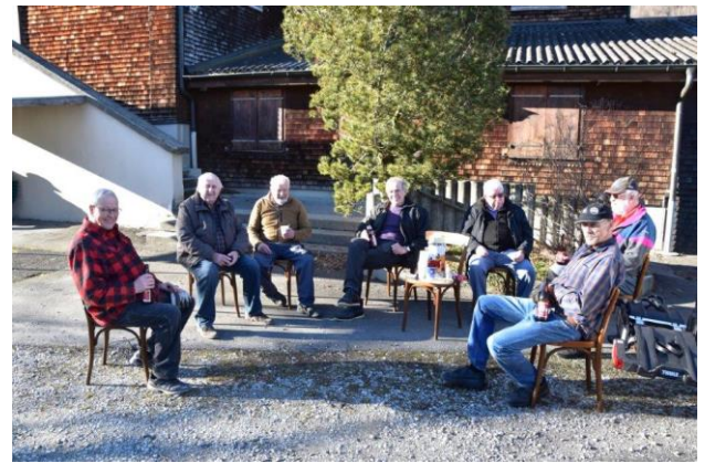
Wuff, alles geschafft ein Bier tut jetzt gut