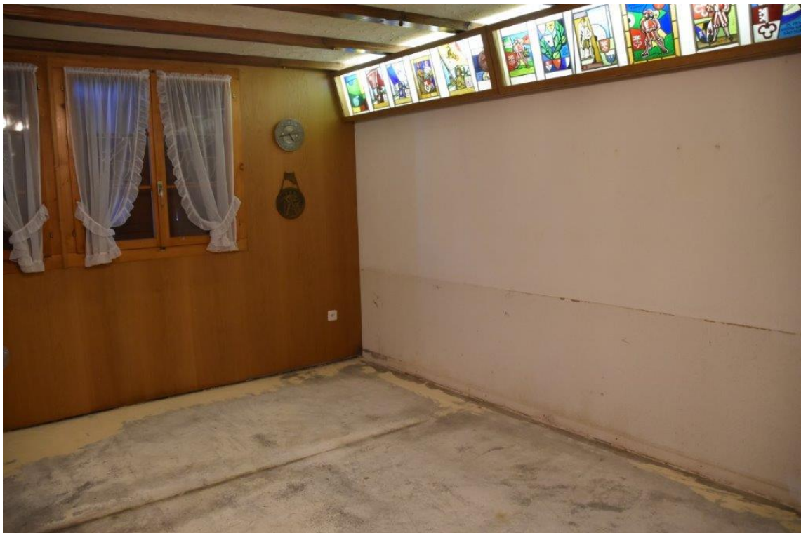
So sieht es jetzt aus"

Und wie es dann aussieht das siehst im nächsten INFO