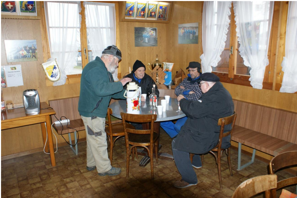
So hat es ausgesehen,